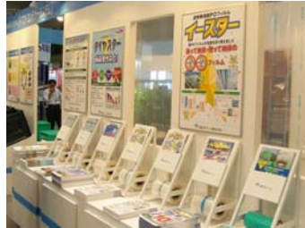
■被覆資材コーナー