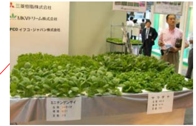
■葉菜類用新方式養液栽培システム「ナッパーランド」