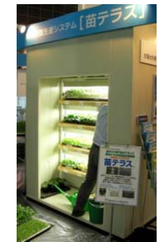
■人工光・閉鎖型苗生産装置「苗テラス」