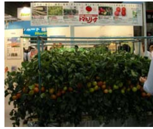
■1段密植栽培システム「トマトリーナ」